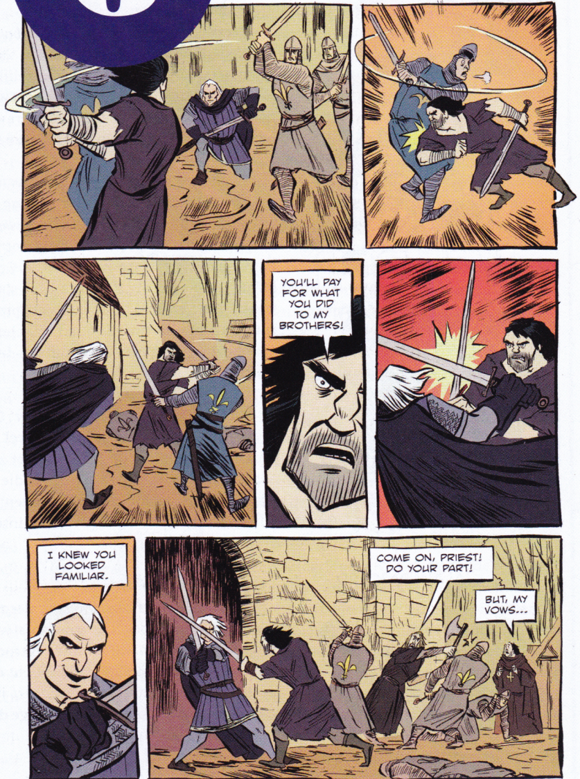
Fragment uit 'Templar'. (Copyright Mechner/Puvviland/Pham, 2014)

Zes goede strips, u aanbevolen door enthousiaste striplezers. In deze Strippgids vindt u de keuze van cartoonist Lectrr.