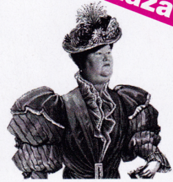
Maggie Deblock Staatssecretaris

Gravure p23 "Mijn manier van werken, als dokter en als staatssecretaris is, luisteren, antwoorden, diagnoses stellen, en de beste remedie zoeken. Ik vraag me af of de ziele in het bed moet liggen in die apfel op te eten."